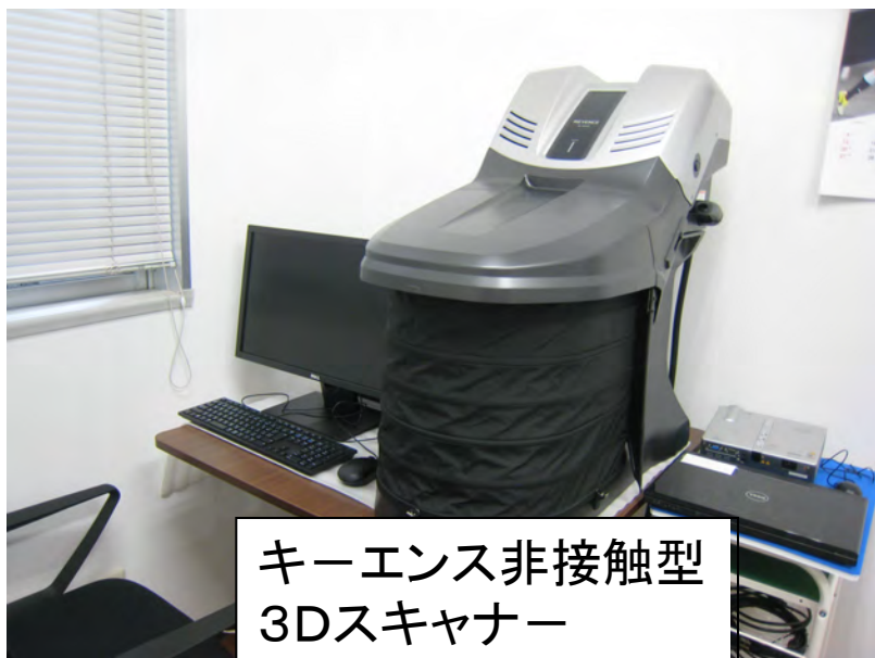
キーエンス非接触型 3Dスキャナー